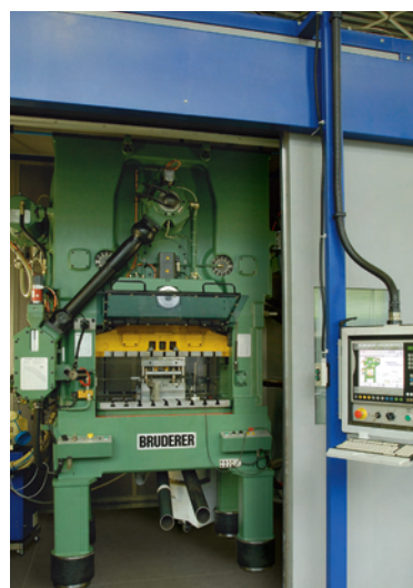
Parc de presses, jusqu'à 400 T, 1125 coups / min