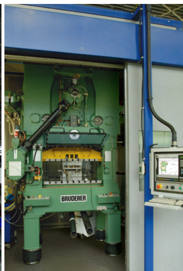
Press park, up to 400 T, 1 125 strokes / min